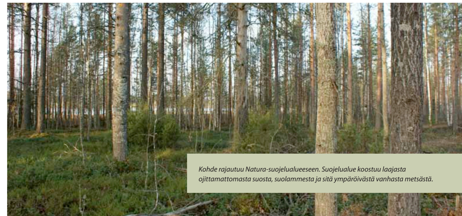
Kohde rajautuu Natura-suojelualueeseen. Suojelualue koostuu laajasta ojitamattomasta suosta, suolammesta ja sitä ympäröivästä vanhasta metsästä.