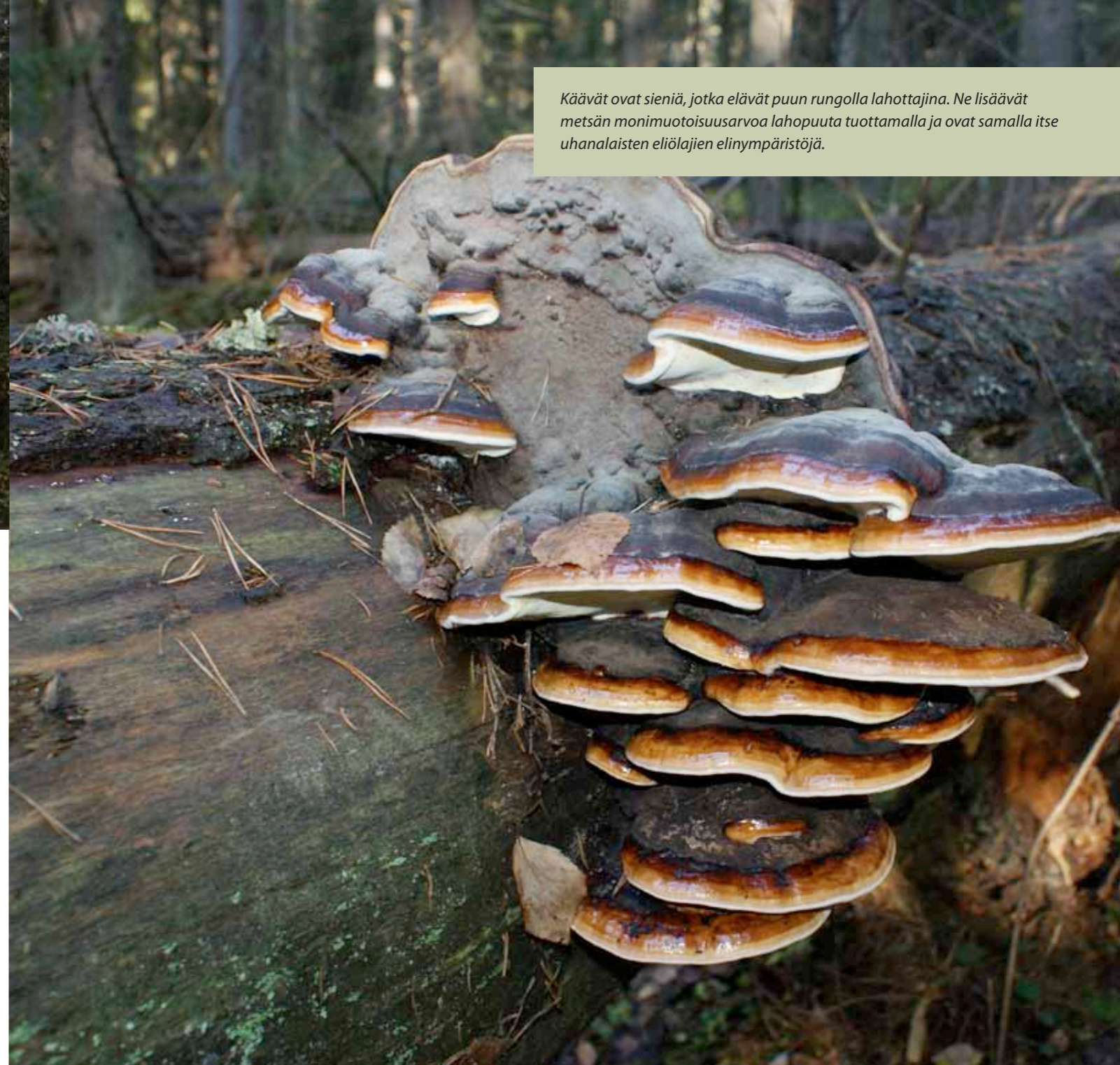
Käävät ovat sieniä, jotka elävät puun rungolla lahottajina. Ne lisäävät metsän monimuotoisuusarvoa lahoppuuta tuottamalla ja ovat samalla itse uhanalaisten eliölajien elinympäristöjä.